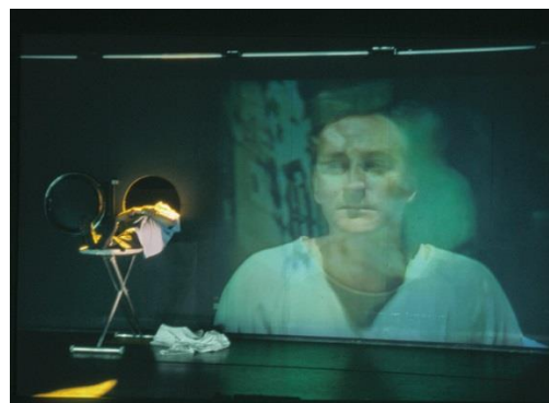
« La Face cachée de la lune », rež. R. Lepage.